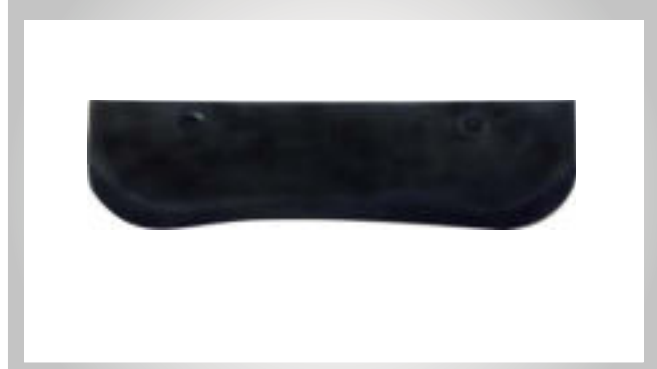
محافظ پلاستیکی لق کن

TURBO I , TURBO IT, TURBO III , TURBO III T TURBO V , TURBO VT, TURBO VII , TURBO VII T