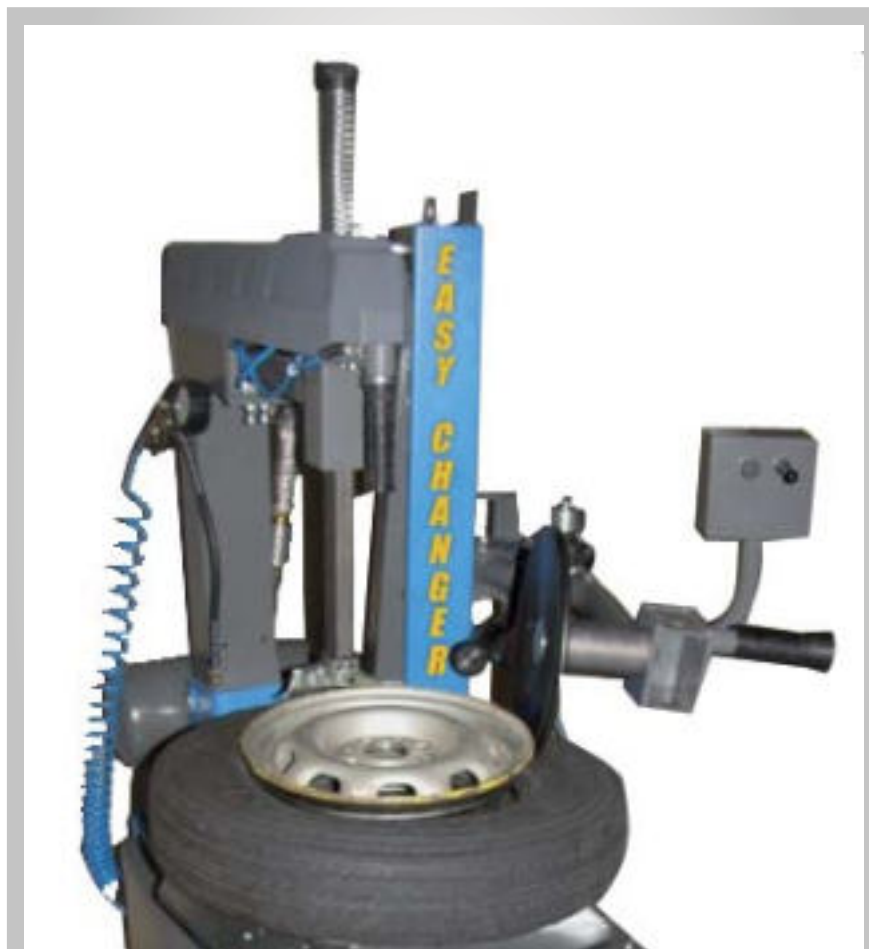
آپشن کمکی لاستیک درآر Easy Changer ( به منظور استفاده راحت کاربر )