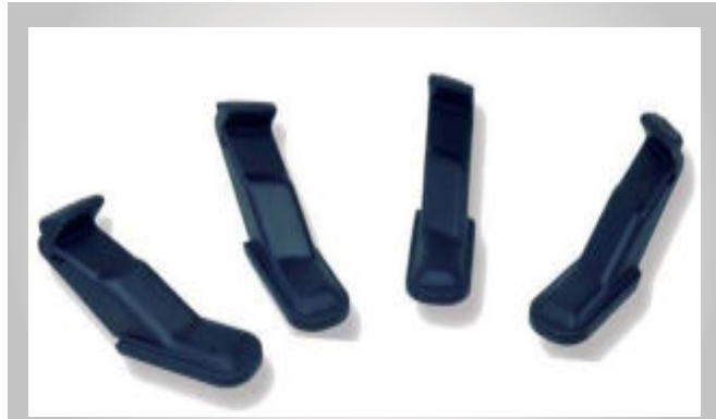
کاور پلاستیکی ناخنی