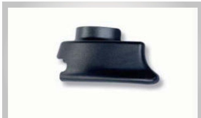
محافظ پلاستیکی مشتی تایلیور